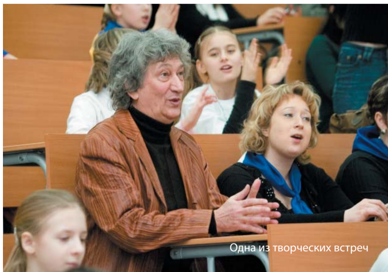
Одна из творческих встреч

Завести зал – такую задачу поставили перед собой «Алёнушкам» из Барнаула, и надо сказать им это отлично удалось. К слову, после первой же репе-