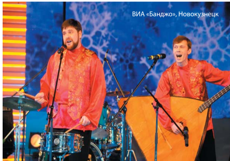
ВИА «Банджо», Новокузнецк

Детская команда Томсктрансгаза побилла все рекорды: из шести выступлений – шесть призовых мест и специальный