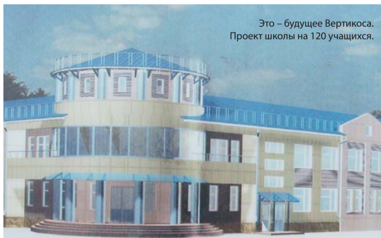
Это — будущее Вертикоса. Проект школы на 120 учащихся.

В этом году впервые в истории Томсктрансгаза все бригады инженерно-технического центра получили переносные компьютеры — ноутбуки. Это решение, инициированное сотрудниками УАТИИ и поддержанное руководством предприятия, неслучайно. Теперь специалисты ИТЦ обеспечены столь необходимым для них компьютером непосредственно на трассе. Компьютеризация в Томсктрансгазе имеет массовый характер. Рабочие места всех диспетчеров, включая самые отдалённые промплощадки на севере Томской области, оснащены новейшими моделями ПК и мониторами. В центральной диспетчерской установлена видеостена общей площадью восемь с половиной квадратных метров, которая будет проецировать на экран данные о работе газотранспортной системы. Важно, что дооснащение компьютерной техникой происходит системно, в соответствии с принятой программой, рассчитанной до 2010 года. Результатом программы станет высокая степень автоматизации рабочих мест. Причём не только инженерно-технического, но и рабочего персонала.